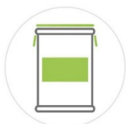
FÛT 210 Kg