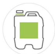
BIDON 20 Kg