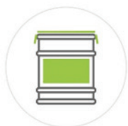
SEAU DE 8KG